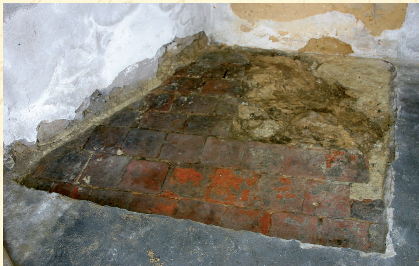
Archeologický výzkum v kapli odkryl základ oltářní mensy z opukových kamenů a původní dlažbu z cihlových dlaždic - topinek.