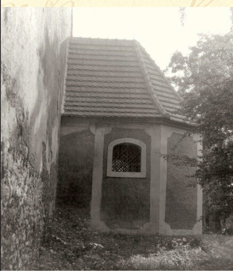
Kaple sv. Ludmily a Marty od východu na konci 60. let 20. století.