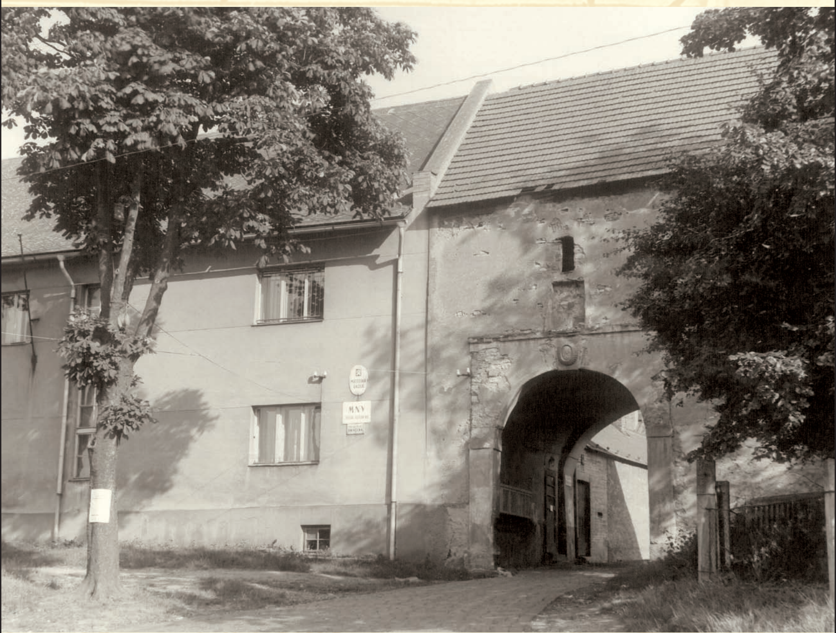
Na konci 60. let 20. století sídlil v č.p. 1 (nejstarší část jezuitského dvora) Místní národní výbor.

Darování dvora jezuitské koleji bylo teprve roku 1581 stvrzeno darovací listinou, vloženou roku 1584 do Desek zemských. Kopaninský dvůr se tak stal vůbec prvním majetkem jezuitů na našem území do nich zapsaným. Jezuité však v Přední Kopanině získali i další majetek náležející původně pražské kapitule a potom augustiniánskému klášteru u sv. Tomáše. Byly to pozemky, které od něj koupili šest let před získáním samotného dvora, čímž jednoznačně deklarovali zájem o zakoupení se ve zdejší lokalitě. Jednalo se o pole a porosty, sahající až k cestě řečené Juliána.