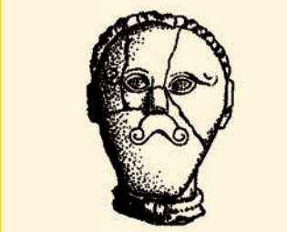
SCHÉMA SPOLEČNOSTI ARCHAIA